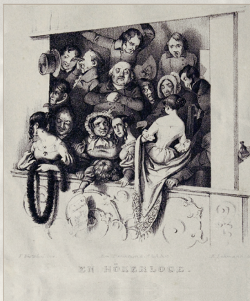
Litografi af Edward Lehmann efter tegning af Fritz Wepphal, Teatermuseet i Hofteatret

Teaterglade og teatergale amatørskuespillere (dilettanter) stod bag teatret. Ambitionerne var høje, og man spillede, som var det professionelt. Det Kongelige Teater i København var den store inspirationskilde. Men næppe alle dilettantspillerne havde selv været i hovedstaden. Man spillede kun lystspil og vaudeviller.