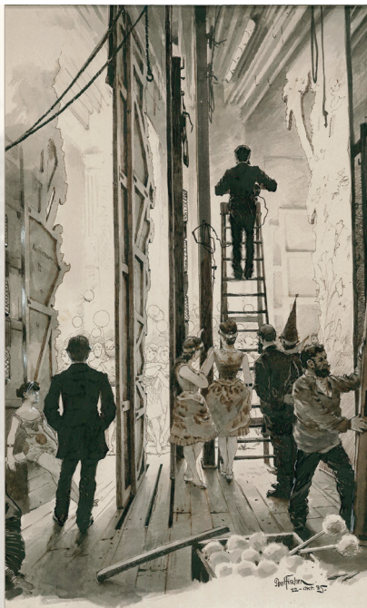
Paul Fischer, 1885. Teatermuseet i Hofteatret

at styrke både perspektiv og publikums udsyn. På gulvet og på balkonen var der bænkerader. Fra starten var der intet hejseværk – og det er heller ikke siden blevet tilføjet. Teater havde mindst 3 faste kulisser: Salen, Skoven og gaden. I dag findes der kulisser sæt fra midten af 1800 tallet, men de bruges ikke.